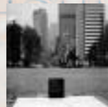
Dalle de New York, États-Unis, jardins des Nations Unies