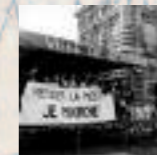
Dalle de Roubaix, France, place de l'hôtel de ville