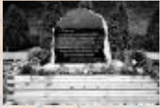
Dalle de Rouyn-Noranda, Québec, Canada, parc central de la ville