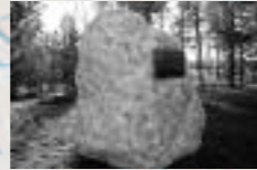
Dalle de Longueuil, Québec, Canada, dans le grand parc municipal de la ville