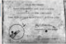
Dalle de Metz, France, sur un pont qui relie un quartier très pauvre au centre historique de la ville