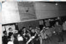
Dalle de Toulon, France, faculté de droit