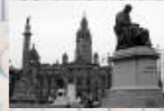
Dalle de Glasgow, Royaume Uni, « George square », point de ralliement des manifestations