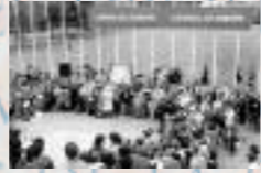
Dalle de Strasbourg, France, parvis du Conseil de l'Europe