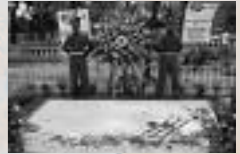
Dalle de Manille, Philippines, « Rizal Park »

En Haïti, les cérémonies du 17 octobre ont souvent lieu dans une école, symbole de la plus haute aspiration des familles vivant dans la pauvreté et du pays dans son ensemble.