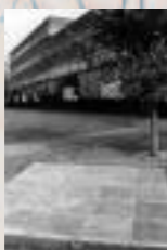
Dalle de La Louvière, Belgique, boulevard des Droits de l'Homme