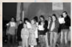
Dalle de Nogent-le-Rotrou, France

Des réseaux de lutte contre la misère sont à l'œuvre jour après jour à l'échelle de la famille, du quartier, de la ville, du pays et du monde. Les célébrations du 17 octobre les portent sur la place publique et contribuent à les renforcer.