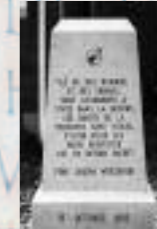
Dalle de Thetford-Mines, Québec, Canada, devant un centre communautaire d'accueil