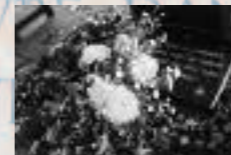
Dalle de Kingstone-upon-Hull, Royaume Uni, au pied d'un mémorial pour les personnes enterrées sans nom