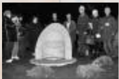
Dalle de Sherbrooke, Québec, Canada, dans le plus grand parc de la ville