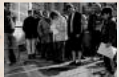
Dalle de La Flèche, France, au cœur d'une cité

Des citoyens, des associations, des institutions publiques et privées du monde entier se sont reconnus dans le message de la Dalle du Trocadéro et en ont été inspirés. Des célébrations sont organisées dans de nombreuses villes, en des lieux symboliques de l'histoire des gens très pauvres et de la citoyenneté de tous. Des répliques de la Dalle du Trocadéro sont scellées dans certains de ces lieux.