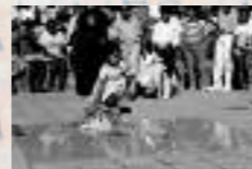
Dalle de Saint-Denis, île de La Réunion, devant le grand théâtre de Champ Fleury