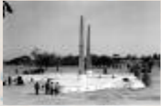
Dalle de Manéga, Burkina Faso, face au musée de Manéga, carrefour entre l'homme et la culture d'Afrique