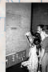
Dalle de Genève, Suisse, Bureau International du Travail