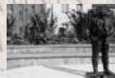
Dalle de Besançon, France, place de la mairie, rebaptisée « Esplanade des Droits de l'Homme »