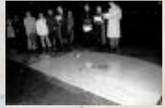
Dalle de Rome, Italie, parvis de la cathédrale Saint-Jean de Latran