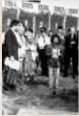
Dalle de Berlin, Allemagne, au pied du mur de Berlin