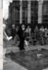
Dalle de Bruxelles, Belgique, parvis du Parlement Européen