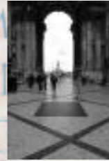
Dalle de Lisbonne, Portugal, rue Augusta, axe central de la ville