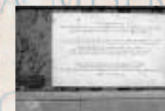
Dalle de Gand, Belgique, place principale de la ville