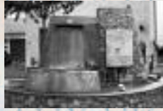
Dalle de La Garde, France, place du marché rebaptisée « Place des Libertés », à côté de la mairie