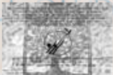
Dalle de Marseille, France, place de l'Espérance où est érigée la sculpture d'un arbre de l'Espérance