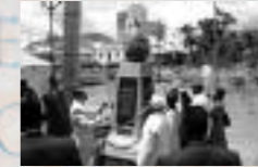
Dalle de Port Louis, Maurice, centre ville, près d'une stèle reprenant le texte des droits de l'homme