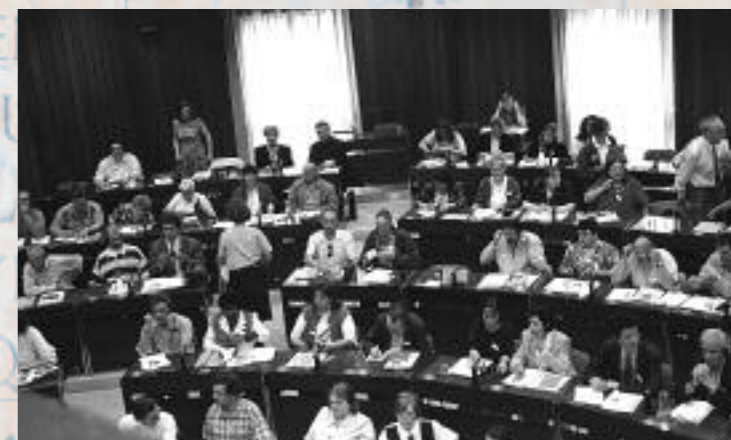
Comité économique et social européen, le 6 juin 1997

« Beaucoup pensent que les pauvres se reposent sur les institutions et les gouvernements pour avoir des secours. Ce que l'on ne sait pas, c'est que les communautés les plus pauvres s'entraident chaque jour. Pour vaincre l'extrême pauvreté, les pauvres eux-mêmes doivent être impliqués. »