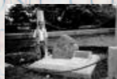
Dalle de Davao, Philippines, près d'un lieu de massacre et de misère