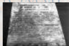
Dalle de Ozamis City, Philippines, au milieu d'un endroit où habitent des familles très pauvres