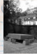
Dalle de Luxembourg, Grand Duché du Luxembourg, « table de solidarité et de fraternité », centre culturel de rencontre